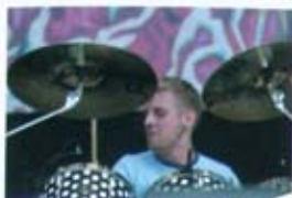
Brann Dailor Mastodon

MENSILE - poste italiane spa - sped. abb. post. d.l. 352/2003 (conv. in l. 27/02/2004 n. 46) art. 1 comma 1 - dir. roma - anno 19