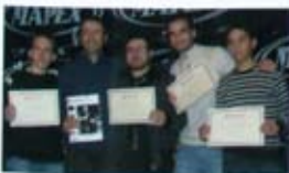
Drummer Of Tomorrow